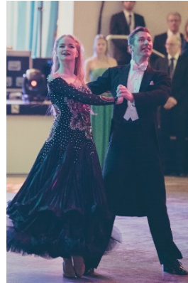
Galaball der Tanzschule Wendt in Ulm