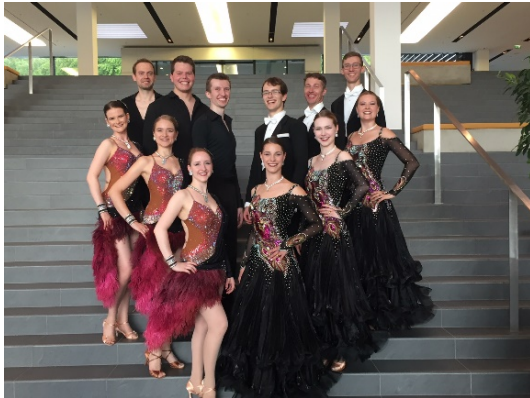
Ärztetkongress der Deutschen Lufthansa AG

Seit unserer Gründung tanzen wir regelmäßig Auftritte zu verschiedensten Anlässen und können deshalb auf einen reichhaltigen Erfahrungsschatz zurückgreifen.