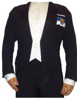
Ihr Logo auf den Fräcken (bis zu 40cm 2 )

Neben der Möglichkeit einer einfachen Spende mit Ausstellung einer Spendenquittung bieten wir Ihnen außerdem die Möglichkeit, Ihr Firmenlogo auf unserer Webseite und den Sozialen Medien, aber auch auf unserer Kleidung zu platzieren: