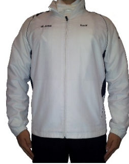
Ihr Logo auf Trainingskleidung